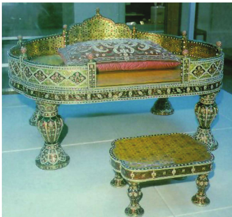
1849-cu ildə hədiyyə kimi ingilis kraliçası Hazırda İstanbuldakı Topqapı muzeyində saxlanılan Təxti- Nadiri.