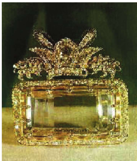
Viktoriyaya göndərilən Kuhi-Nur almaz hazırda London qəsrindəki muzeydə saxlanılır.