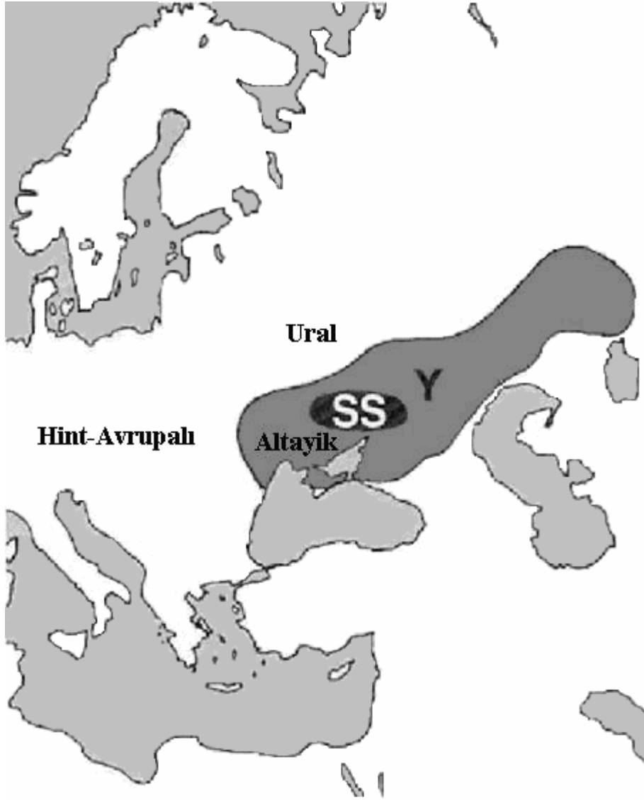
IV . ve III. binli yıllardaki at biniciliği merkez sahası ( SS=Serednyi Stog kültürü) ve atlı-savaşçı ( F=Yamnaya ) kurgan gruplarının yayılması (Mario Aline'inin çalışm asından), (Rekonstrüksiyon, F.Ş.)