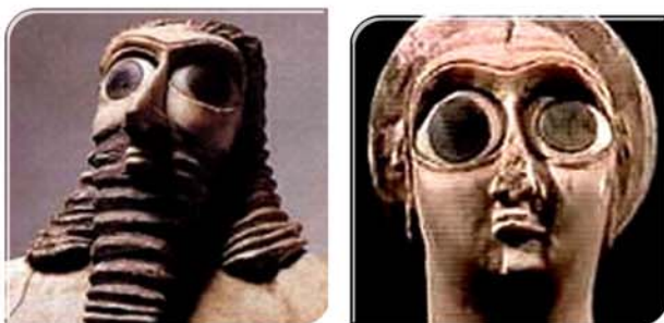
پروفسور معزز علمیه چیغ برگردان: روح اله صاحب قلم

پژوهشی پیرامون ریشه های کتب مقدس در کتیبه های سومری بحثی نو در قرآن پژوهی