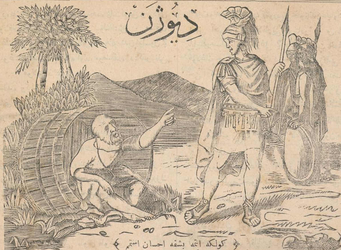
کولکه ایتمه بشقه احسان استم

هفته ده بر دفعه طبع ونشر اولتور . غزته خانه سی غلطه ده یکی جامع جاده سنه واقع زنجیری خان دروننده کاشندر . برسنه لکی نصف عثمانی لیراسنه والی ایلغی ۱ - مجیدیه و برسنه سی ۱ غروشه در طشره ایچون پوسته اجرتی ضم اولتور . اعلاناتک هر سطرندن ۳ غروش و مواد سارنه ک سطرندن ۶ غروش النور .