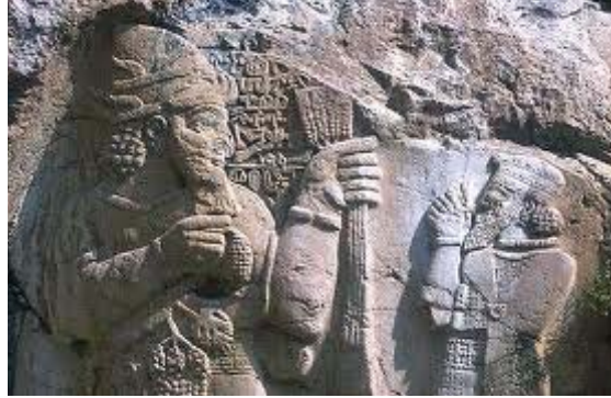
Hatti-Hitit bereket tanrısı Tarhundaş'a Nart mitolojisindeki Nart Thağalec gibi üzüm tohumları ve buğday başakları ile birlikte gösterilmektedir.