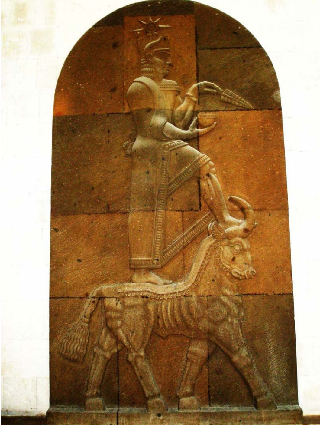
Urartu-Hatti Tanrısı Teişeba-Teşup

Yine de Nart Sosriko'nun Fırtına tanrısı Teişeba-Teşup ile olan benzerliği Nart mitolojisindeki diğer karakterler ile Anadolu ve Mezopotamya'nın pagan tanrıları arasında yapılacak yeni tematik okumaların önünü açmaktadır.