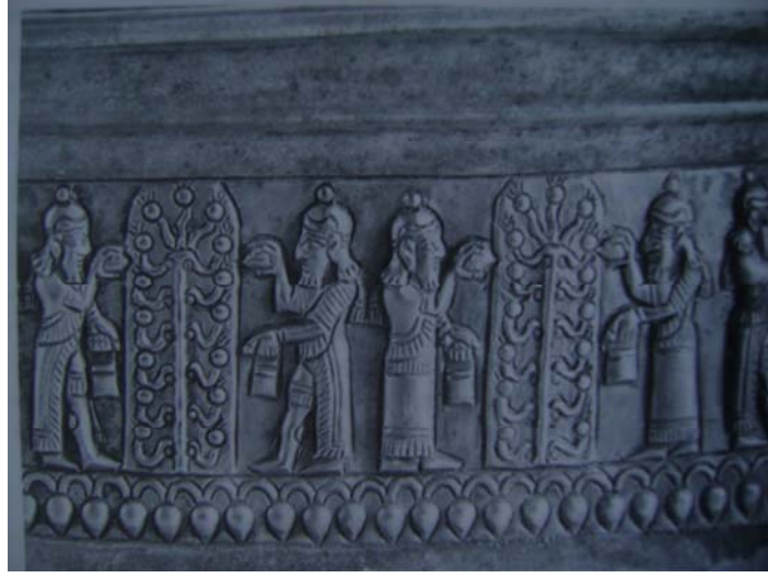
Urartu dönemi bakracından detay: Hayat Ağacı 12

Nart Sosriko doğmadan kâhinler bir kehanette bulunmuşlardır. Anlatıcılara göre Nart Sosriko'nun doğmasıyla birlikte Yeryüzünün yağı ve yiyeceklerin tadı kaybolacaktır. Yani kıtlık dönemleri baş gösterecektir.