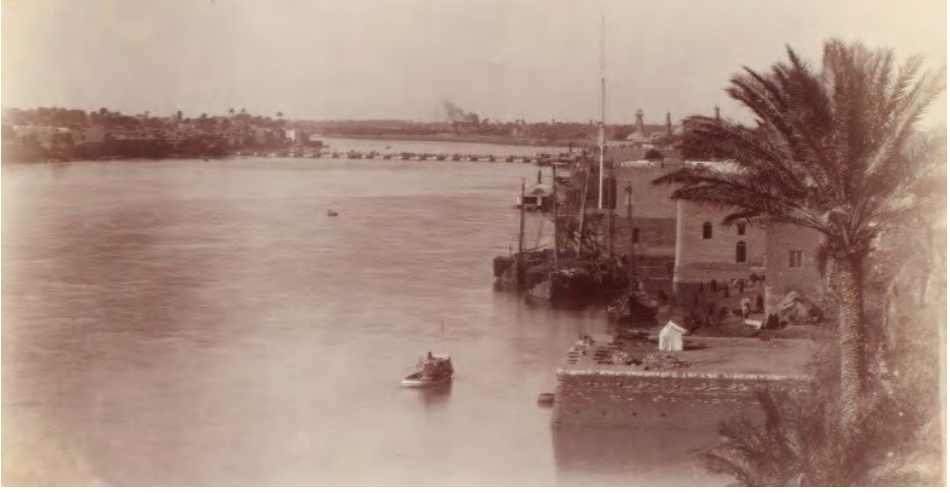
Bağdat - İngiliz Siyasi Temsilciliğinin Çatısından Dicle ve Bağdat'tan Bir Görünüm.

İngiltere yaşanan bu gelişmeler sırasında Arap Yarımadası'ndaki varlığını Kuveyt Emiri Şeyh Mübarek, Necid Emiri Abdülaziz İbn Suud gibi liderler ile sağlamlaştırırken, Osmanlı Devleti karşısında yavaş yavaş beliren milliyetçilik hareketlerini kendi çıkarları doğrultusunda yönetmek istemiştir. Tabii burada belirttiğimiz milliyetçilik, Balkanlarda oluşan milliyetçilikten ziyade, kabile liderleri üzerinden oluşum gösteren, bireyi ön plana alan değil, daha çok itaat kültürü içerisinde liderler üzerinden gelişim göstermiştir. Bu anlamda İngiltere bölge halkını topyekûn etkilemekle vakit kaybetmemiş, sadece liderler üzerinden aktif siyaset gütmüştür. İngiltere, Hindistan merkezli yapmış olduğu Ortadoğu politikalarında Basra Körfezi ve Süveyş Kanalı'nı ticaretinin merkezine almıştır. Bu süreçte kurulan Anglo Persian Oil Company gibi şirketlerle bölgede ekonomik üstünlük kuran İngiltere, 1. Dünya Savaşı'nda petrol bölgelerinin korunması için Irak'ta güçlü bir konumda olmaya çalışmıştır. Irak petrolünün kullanımında kolektif bir şirket olarak varlığını sürdüren Turkish Petroleum Company üzerinde de ekonomik olarak üstünlük kuran İngiltere zamanla Almanya'yı da saf dışı bırakmıştır (Arı, 2008, ss.143-148).