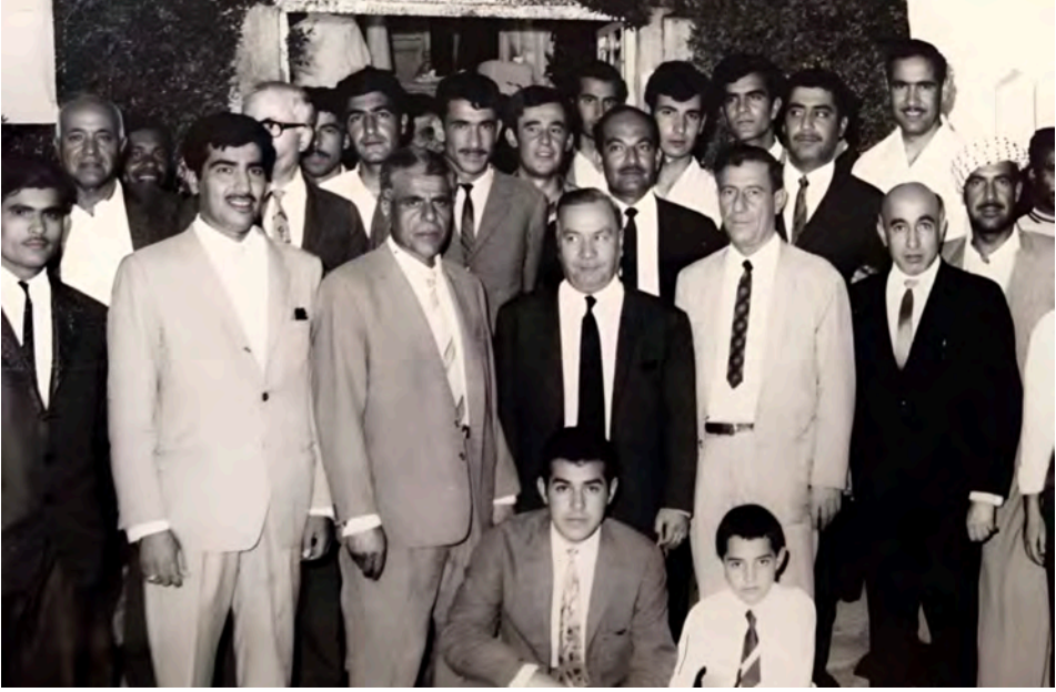
Musul Türkmen Kardeşlik Ocağının Açılış Günü, 1971.