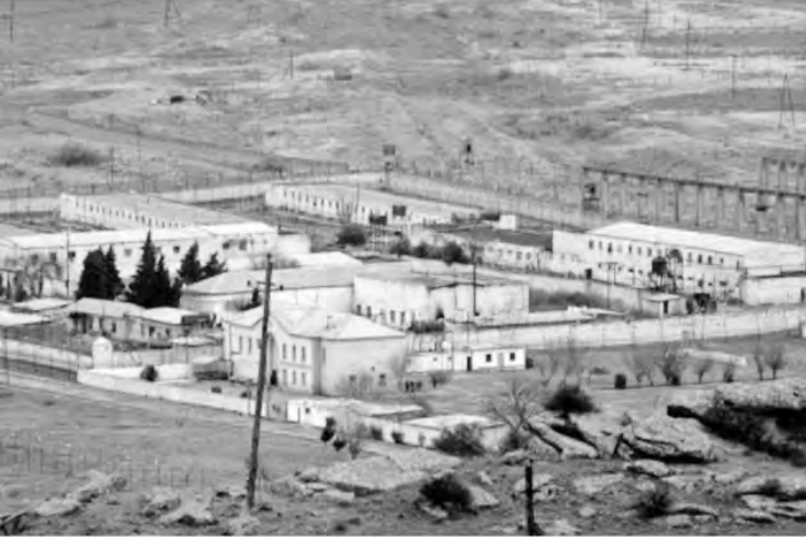
Qobustan qapalı həbsxanasınının Qobustan dağından ümumi görünüşü

Əks təqdirdə həтта həftələrlə burda qalıb ömrü böyu qurtara bilməyəcəyi xəstəliklərlə baş -başa yaşamalı idin.