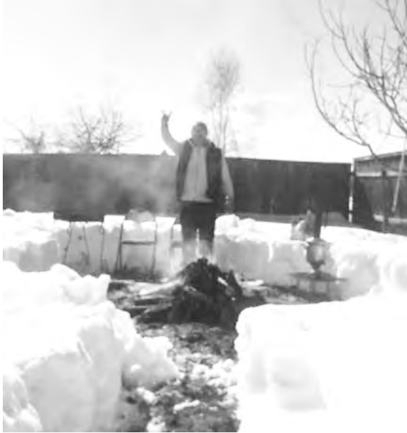
Həbsxanadan sonar Sibirdə keçirdiyim ilxır çərşənbələrindən biri

P.S. Bəs sizin həyatınızda hansı qeyri adi ilxır çərşənbə olub?