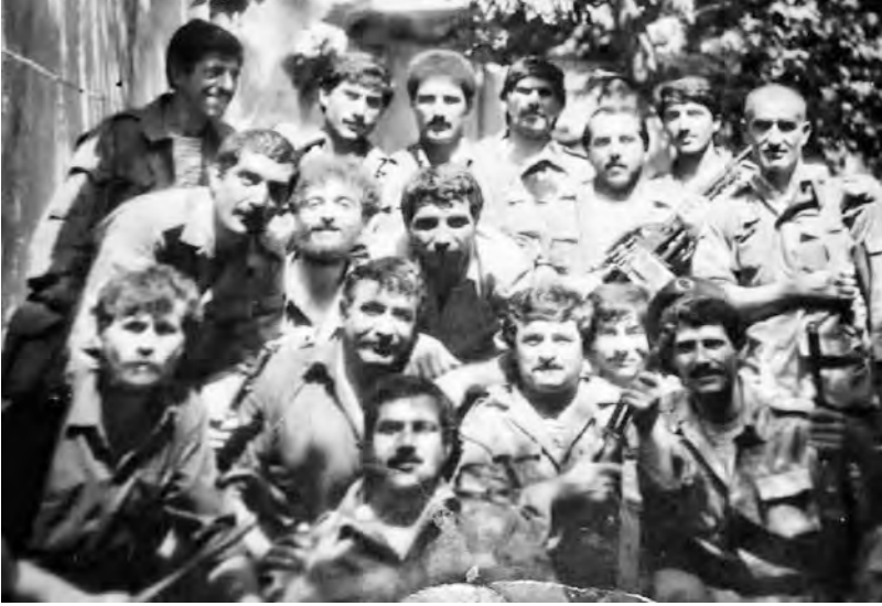
Şəkildə Naxçıvan döyüşçülərindən bir qrupu